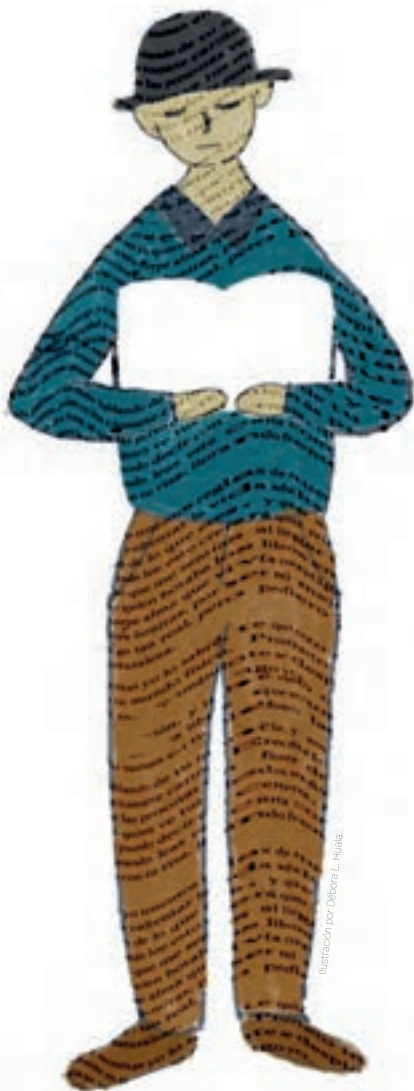
Ilustración por Débora L. Hidalgo

Léeme como hasta ayer Yo te leía Léeme sin prisa ni remilgos Léeme sin miedo a descubrir Alguna página prohibida Mi libro permanece abierto A tus ojos Nada he borrado, No existen paréntesis Todo está claro La letra grande Y sin borrones El renglón doble Léeme te lo ruego No voy a herirte Léeme y anota entonces Alguna frase que no sea suya Léeme porque mis páginas Se van borrando