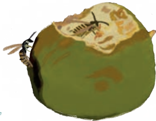
Ilustración por Débora L. Hualla.

Chaqueta amarilla ( Vespula germanica ): es una especie exótica invasora, del tipo avispa. No produce miel. Es una depredadora temible, causando estragos en la cosecha de árboles frutales, panales de abejas, entre otros. Inclusive es rapiñera de carne cruda.